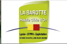
Faisceau hertzien entre le lycée et la BS RCube de Bissey-la-Côte